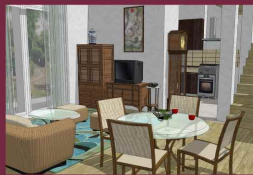
WIZUALIZACJA WNĘTRZA SALONU

POW.: 57,38M 2 POM. POD SCHODAMI: 2,71M 2 BALKON: 5,53M 2