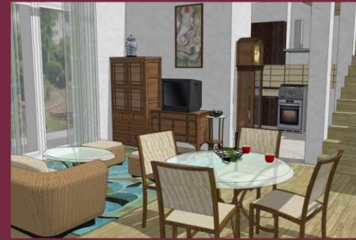
WIZUALIZACJA WNĘTRZA SALONU