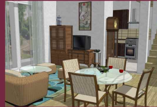
WIZUALIZACJA WNĘTRZA SALONU

POW.: 32,11 M 2 POM. POD SCHODAMI: 2,71 M 2 BALKON: 3,25 M 2